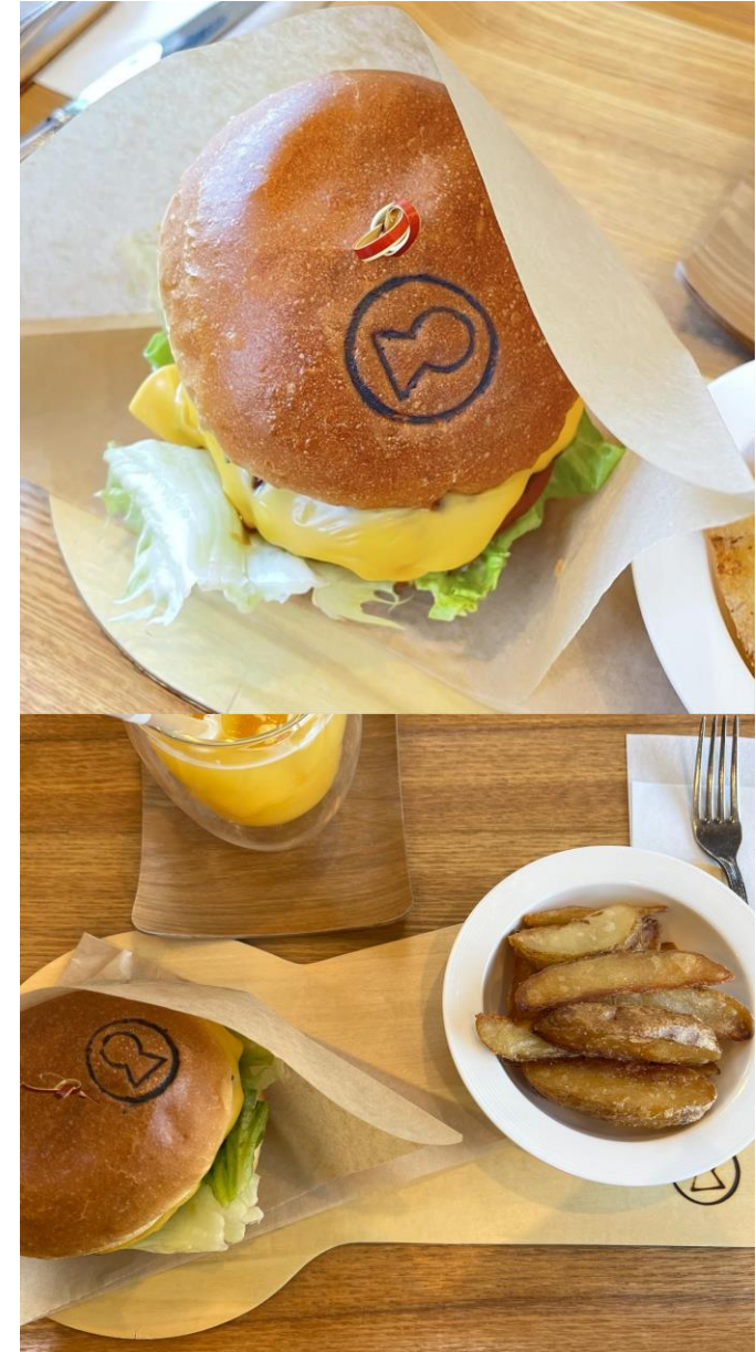
↑こぶんバーガー 1450円